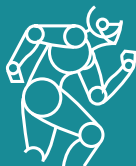
Imagen y ergonomía

Utilizamos materiales que permiten ampliar la vida útil de las prendas.